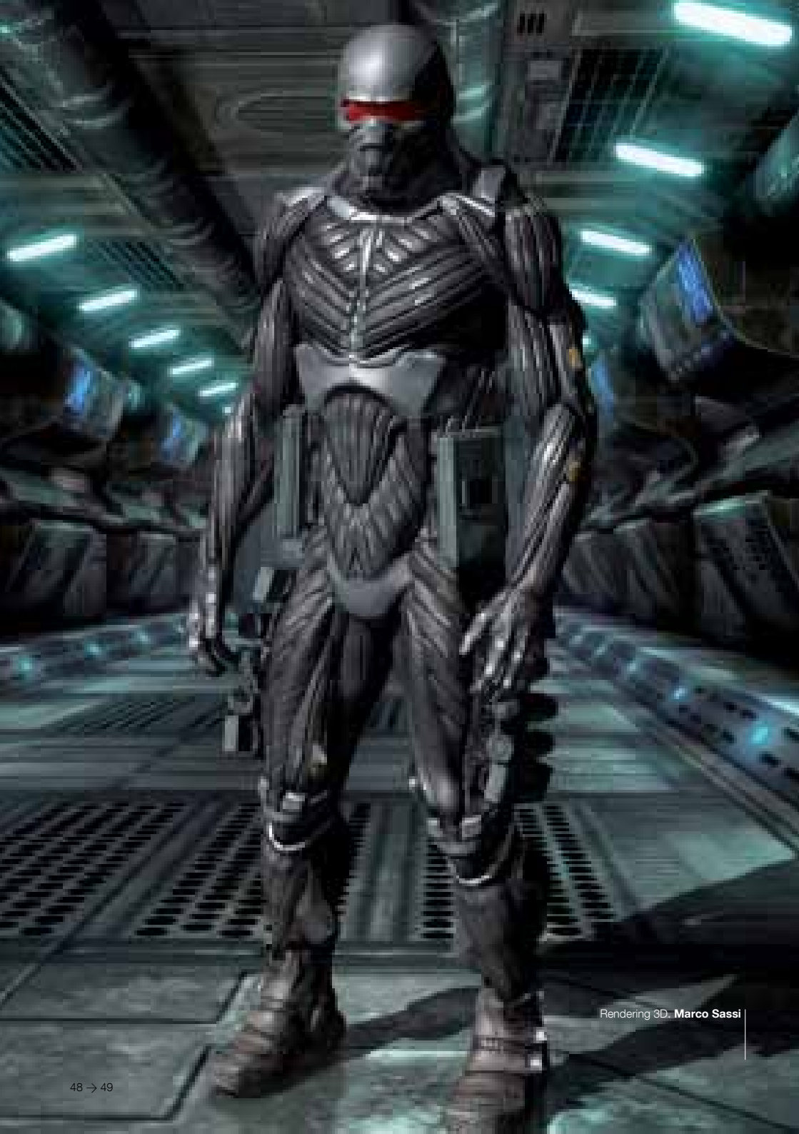
Rendering 3D. Marco Sassi