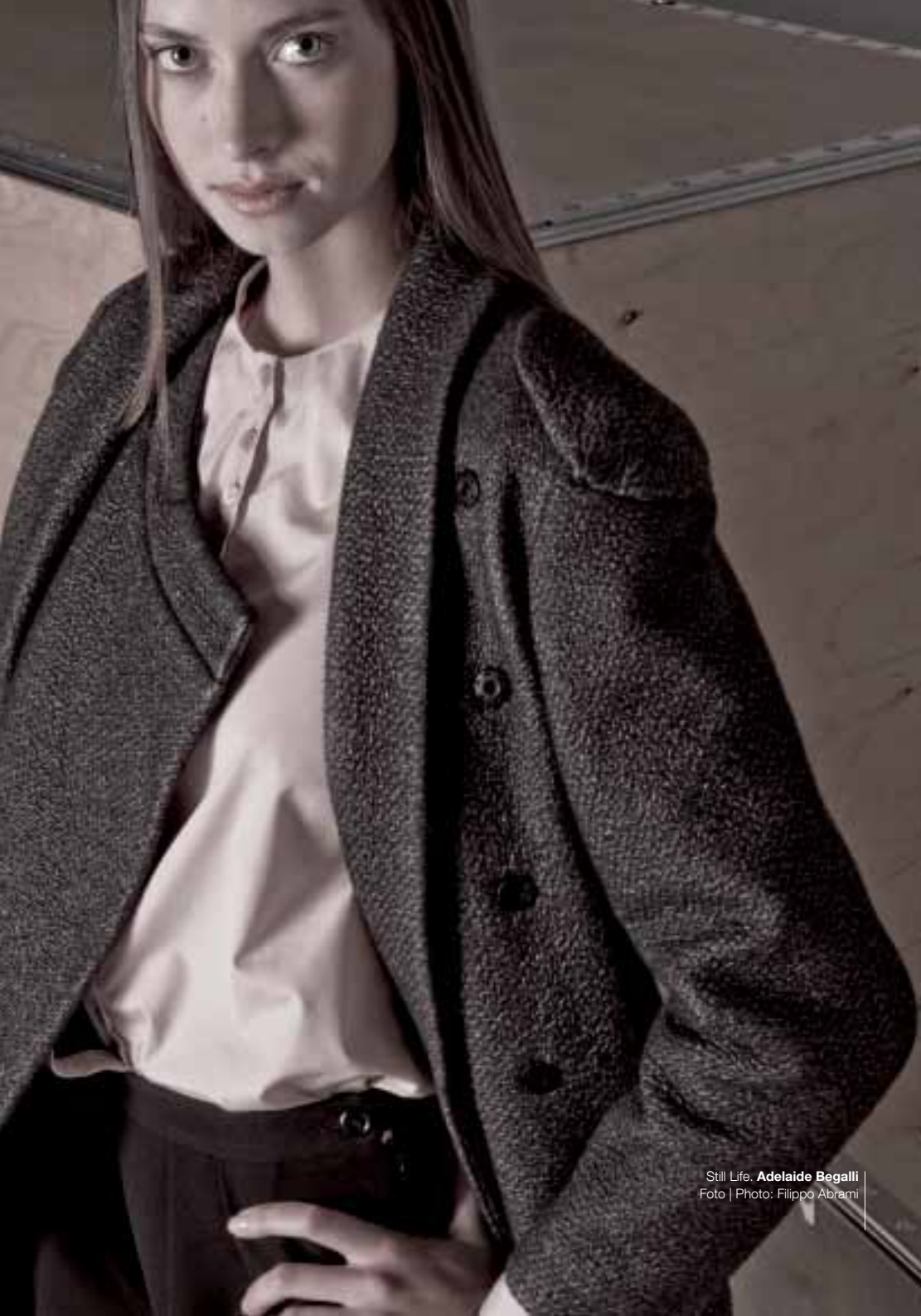
Still Life. Adelaide Begalli